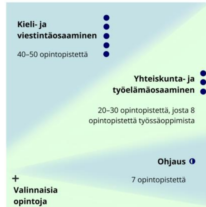
KUVIO 1. KOTOUTUMISKOULUTUKSEN LAAJUUS JA OSA-ALUEET