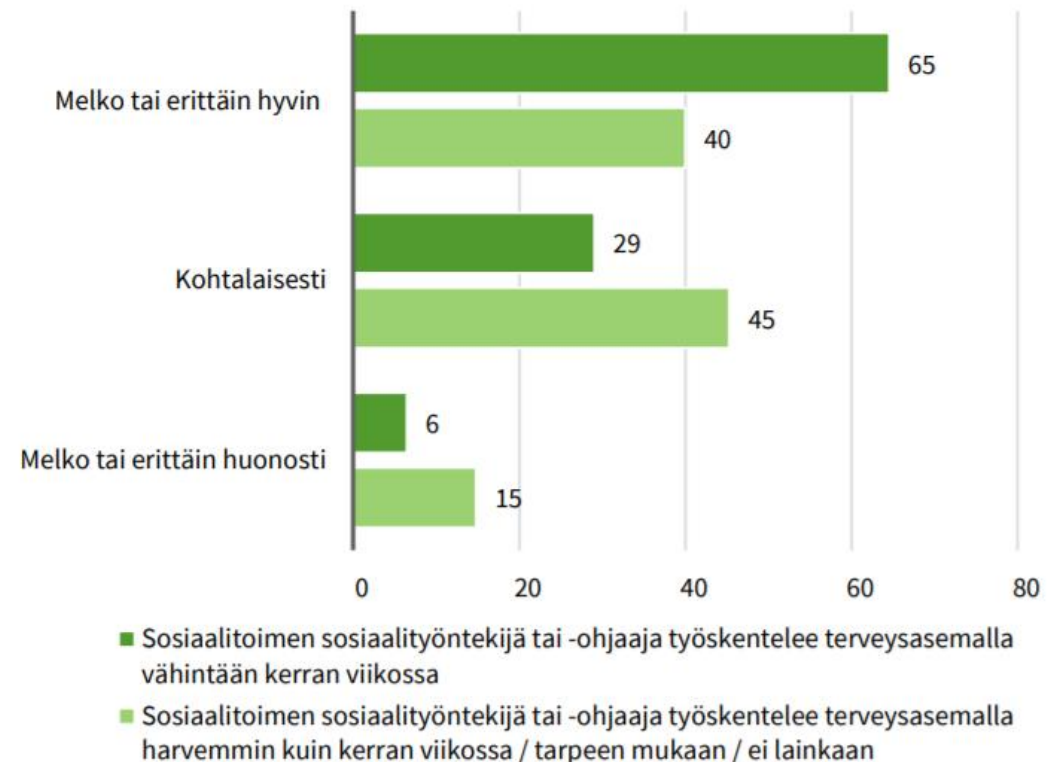
Kuvio 5. Yhteistyön sujuvuus sosiaalipalvelujen kanssa (% terveysasemista)

Syrjä V, Parviainen L & Niemi A. Terveyskeskusten avosairaanhoidon järjestelyt 2019 – Yhteistyö sosiaalipalvelujen ja erikoissairaanhoidon kanssa. Tutkimuksesta tiiviisti 2, 2020. Terveyden ja hyvinvoinnin laitos, Helsinki.